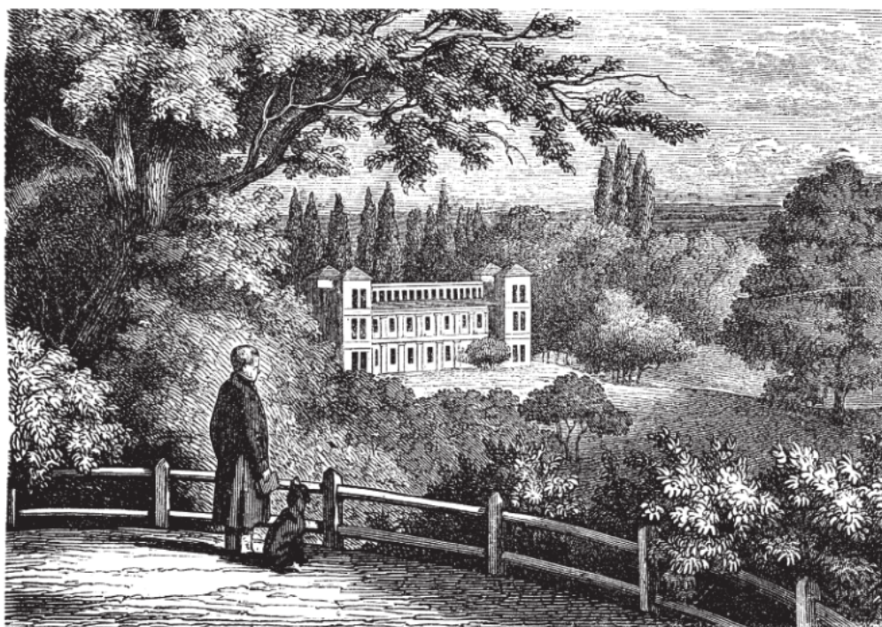
Castelul Tegel și zona din jur

Lui Alexander îi venea deosebit de greu, pentru că îi erau predate aceleași lecții ca fratelui său mai mare, în ciuda faptului că el era cu doi ani mai mic. Drept rezultat, se socotea mai puțin înzestrat decât fratele său. Pe când Wilhelm excela la latină și la greacă, Alexander se simțea incompetent și încet. Mai apoi avea să-i mărturisească unui prieten că trebuia să se străduiască