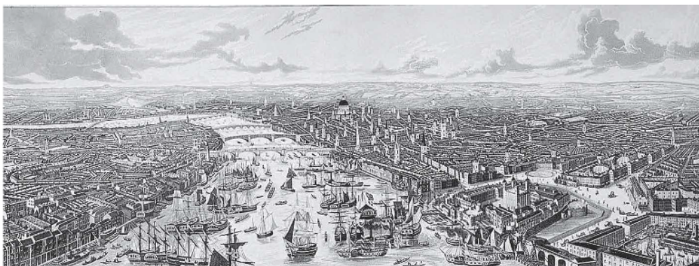
O vedere cu Londra și Tamisa

În jurul lumii, ajuns acum președinte al Societății Regale, cel mai de seamă for științific din Marea Britanie. Humboldt admira ispititoarele tablouri și schițe cu care William Hodges venise din cea de-a doua călătorie alături de Cook. Oriîncotro se întorcea, i se dezvăluiau noi lumi. Chiar și dimineața, primele care-i săreau în ochi când se trezea erau gravurile cu navele Companiei Britanice a Indiilor de Est, care împodobeau pereții dormitorului unde locuia. Lui Humboldt adesea îi dădeau lacrimile când vedea aceste imagini tulburătoare, care-i aminteau de visurile sale neîmplinite. 38 Avea să scrie că „este în mine un imbold de neoprit care adesea mă face să simt că mi-am pierdut mințile“ 39 .